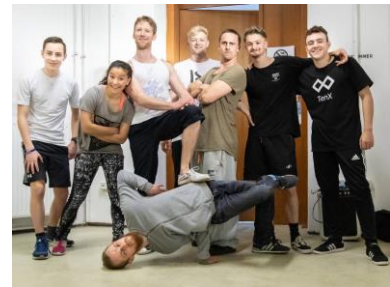
SPISO / Urban Movers